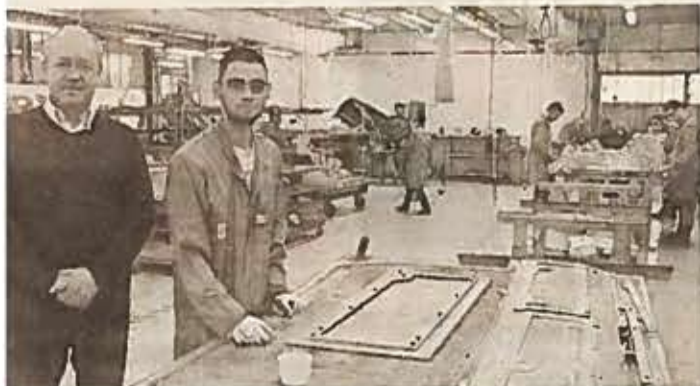
La société Centrair travaille les matériaux composites.

Spécialisée jusqu'en 1986 dans les planeurs, la société Centrair a acquis progressivement un véritable savoir-faire dans les matériaux composites. Elle équipe notamment les gros-porteurs d'Airbus (25 % de sa production), Dassault, Embraer Zodiac en planchers de cabine, carénages, pièces de cockpit, de soute et de conditionnement d'air.